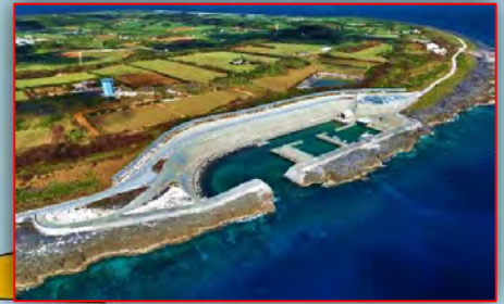
南大東漁港北大東地区 (北大東島)