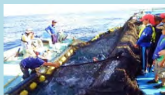
海洋レクリエーション (定置網の体験漁業)