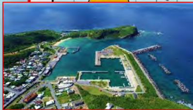
久部良漁港(与那国島)