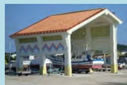
防暑施設・浮棧橋の整備により就労環境の向上