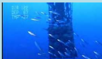
中層魚礁に蝟集したカツオの群れ