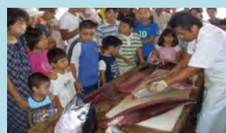
漁港を利用した水産まつり