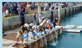
イベントでの稚魚の放流