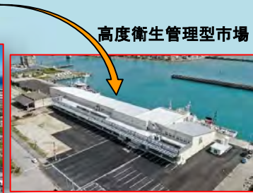
高度衛生管理型市場