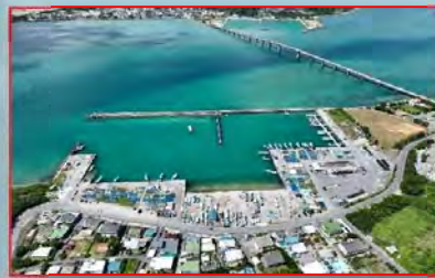
浜漁港(中部:うるま市)