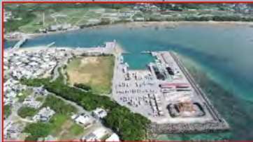
奥武漁港(南部:南城市)