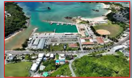
恩納漁港(北部:恩納村)