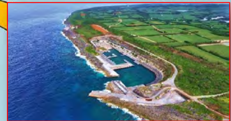
南大東漁港南大東地区 (南大東島)