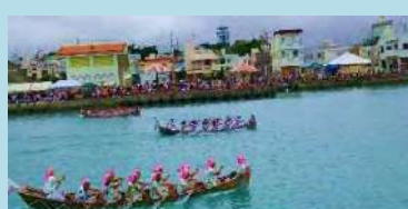
ハーレー(ハーリー)