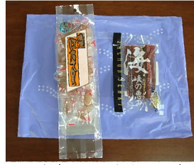
大会で配られたお土産↑