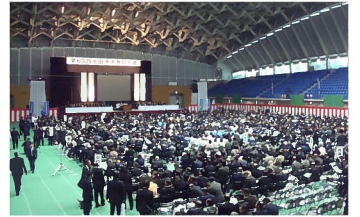
・会場内全景 (全体参加約2,000名)↑