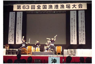
・大会開会前の風景↑