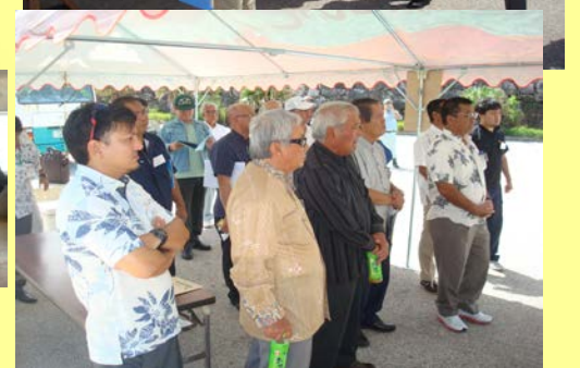
南大東漁港の現地説明