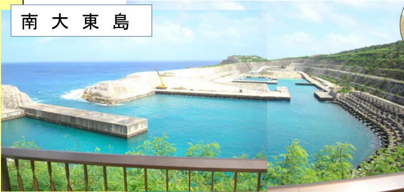
南大東漁港:港口が北に向いているので台風の影響(南からの波)があまりない状況