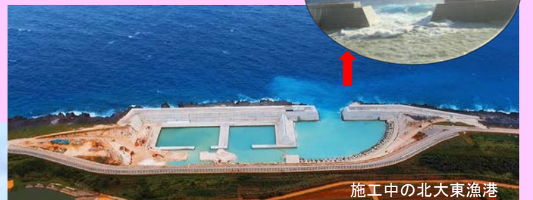
施工中の北大東漁港