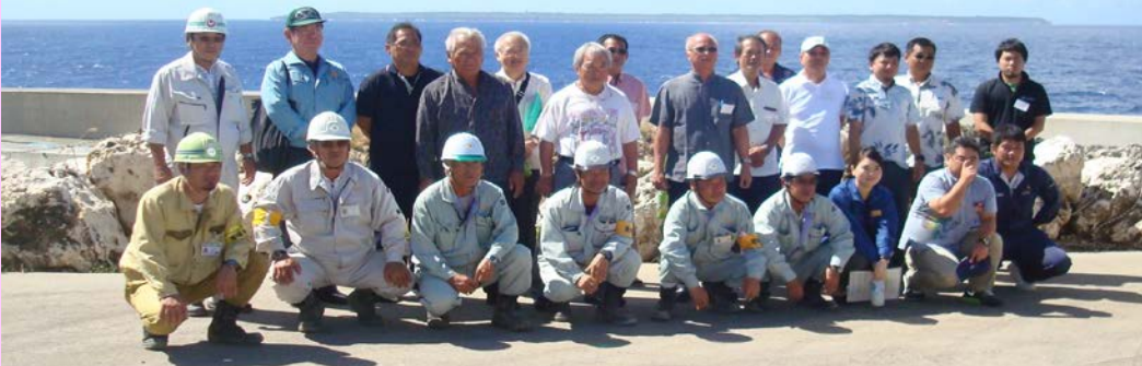
南大東島を背景に北大東漁港での参加者