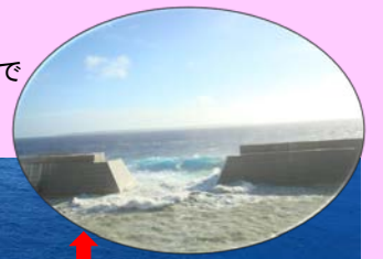
北大東漁港:港口が南に向いているので台風の影響(南からの波)がある状況