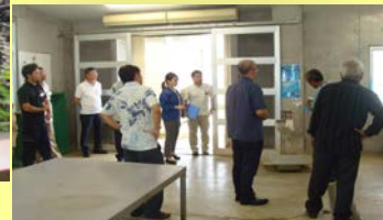
南大東村漁組の説明