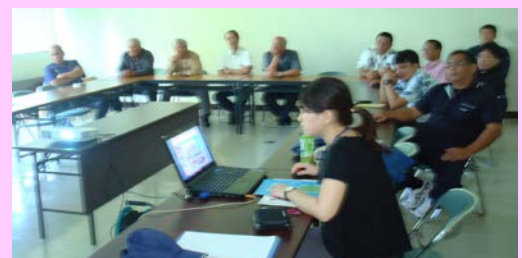
北大東漁港の説明