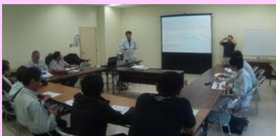
北大東村概要説明