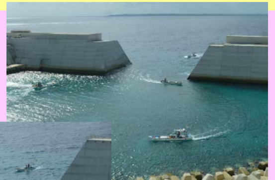
地元漁船の第一泊地への入港状況(第2回 H28.11.30)