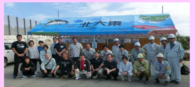
北大東漁港説明用テントの前で集合写真