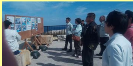
南大東地区の現地説明