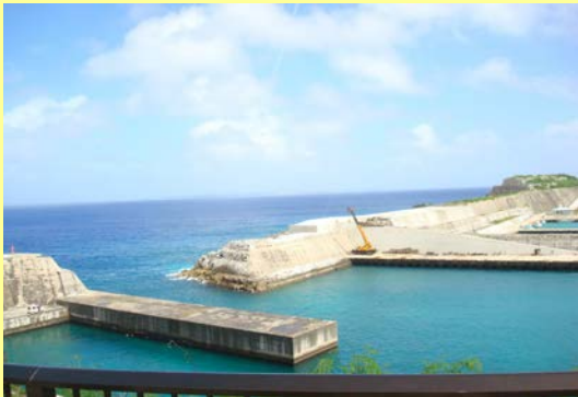
南からの波(台風の余波)の影響があまりない状況(第1回 H28.9.27)