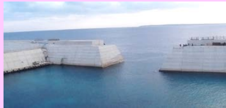
北からの波の影響を受けていない状況(第2回 H28.11.29)