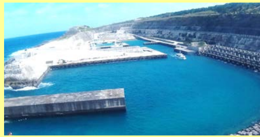
北からの波の影響を受けながらの出港状況(第2回 H28.11.29)