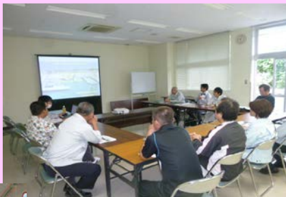
北大東地区の説明状況